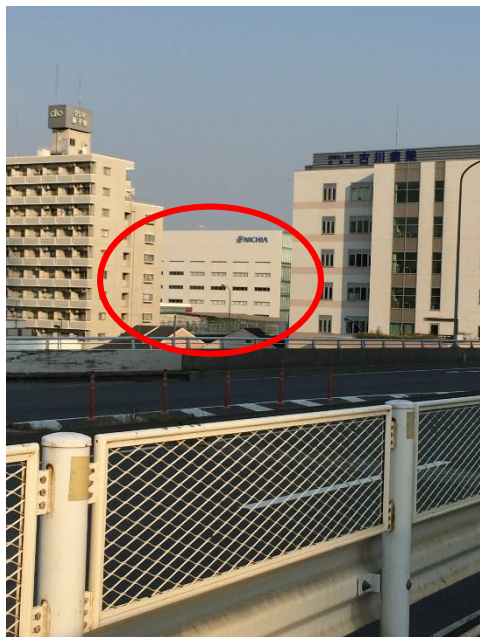
神奈川産業道路に出ると、 その正面左側に日亜化学のビルが見えます。これを目印に...