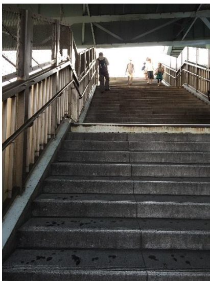
この階段を上りきると...